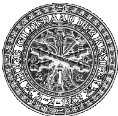
Het zegel van de Hoge Raad der Kempen

De gilde met het hoogste puntenaantal wint het landjuweel op voorwaarde dat zij bereid is het volgende landjuweel te organiseren. Herentals behaalde één keer het Landjuweel, in 1970.